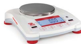
Navigator con piatto rotondo e display LCD