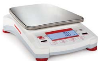
Navigator XL con display LCD