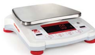
Navigator con piatto quadrato e display LED