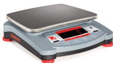
Navigator XT con display LED